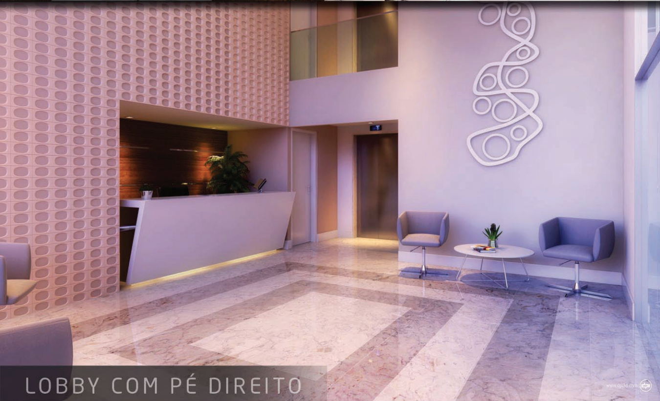
LOBBY COM PÉ DIREITO