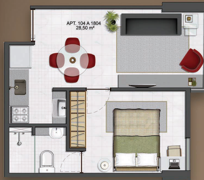
PLANTA TIPO 01 28,5m 2 106 A 1806