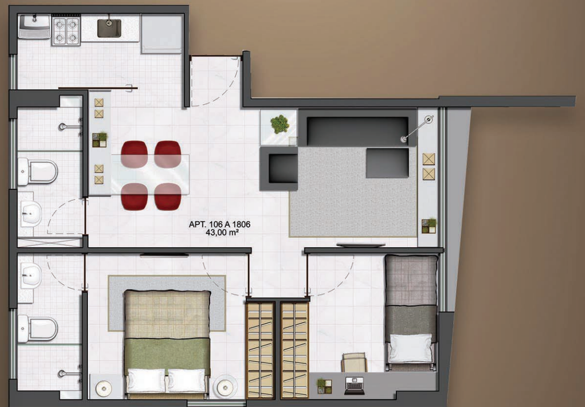
PLANTA TIPO 03 28,5m 2 106 A 1806