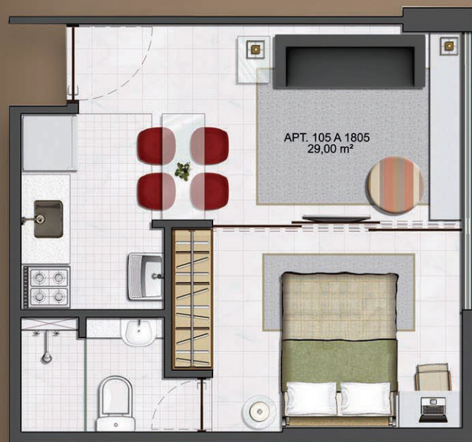
PLANTA TIPO 02 28,5m 2 106 A 1806