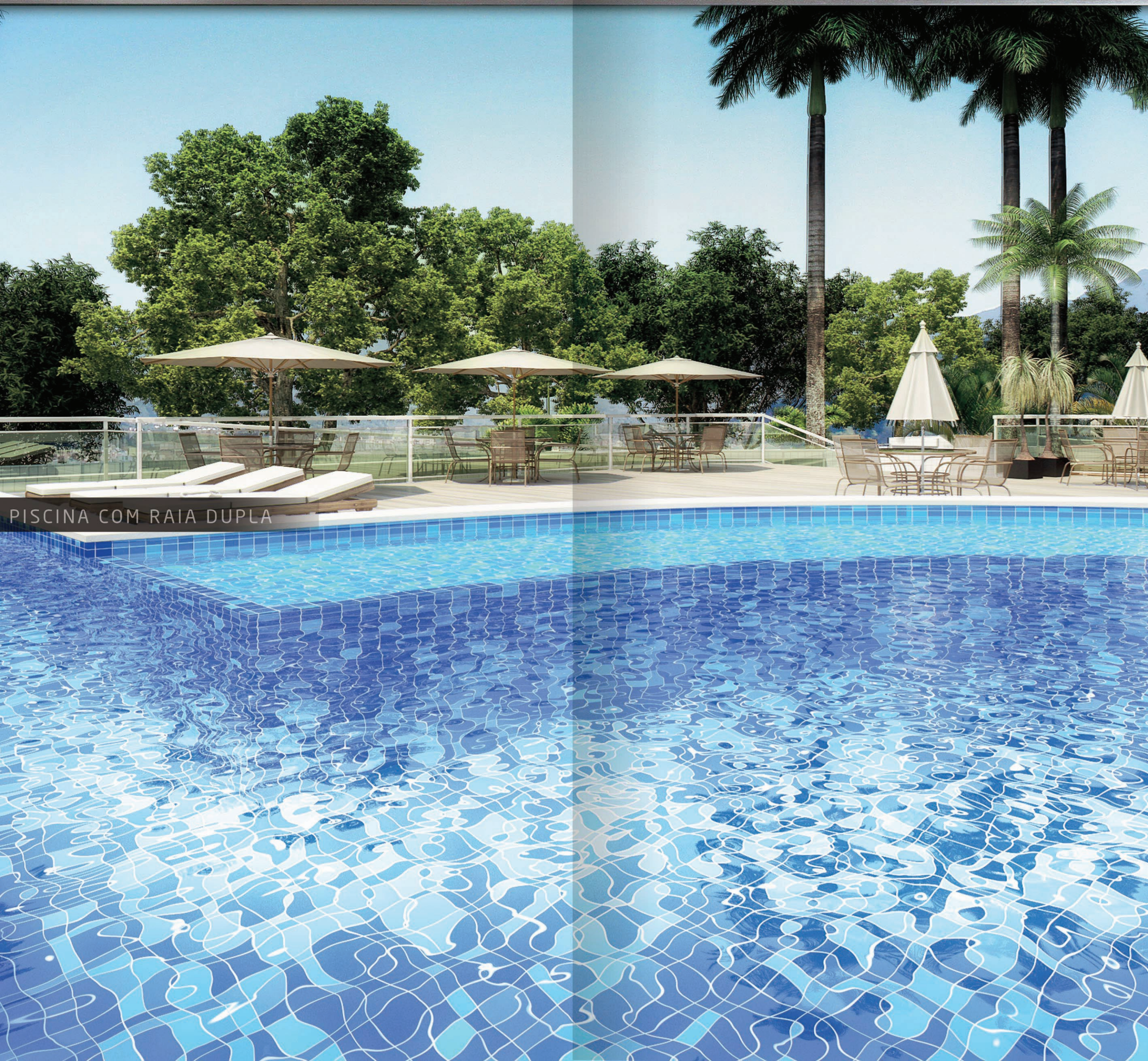
PISCINA COM RAIAS DUPLA